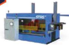
Système d'inspection 3D des rondins d'anodes