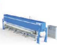
Inspection 3D de surface des billettes