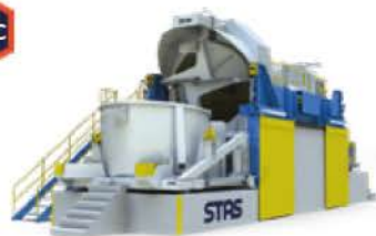
Nettoyeur de creuset d'aluminium chaud