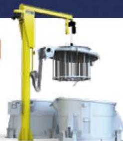
Préchauffeur de creuset d'aluminium