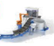
Coulée et empilage de gueuses