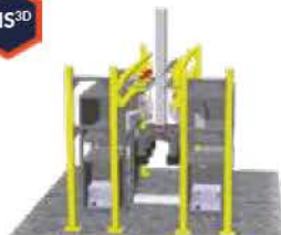
Système d'inspection 3D des clads d'anodes