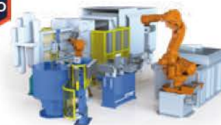
Swirled Enthalpy Equilibration Device (technologie de moulage en phase semi-solide)