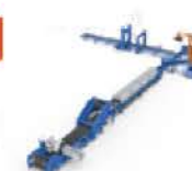
Coulée et empilage de lingots