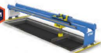
Machine de brasage de cuves