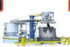
Écumeur d'aluminium en creuset