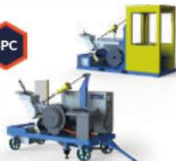
Nettoyeur de siphons