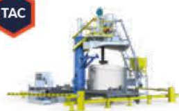
Treatment of Aluminium in Crucible®