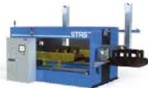
Système d'inspection 3D des mégots d'anodes