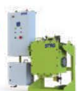
Flux Feeder for Degasser®