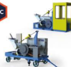
Nettoyeur de siphons