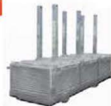
Couvercle de cabarets d'anodes