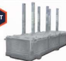
Couvercle de cabarets d'anodes