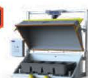
Inert Gas Dross Cooler®