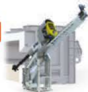
Rotary Flux Injector®