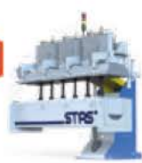
Aluminium Compact Degasser®