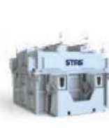
Deep Bed Filter®