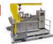
Filtration compacte avancée