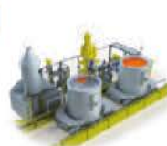
Robot écumeur d'aluminium en creuset